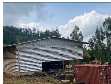
3. โรงซ่อมบำรุง