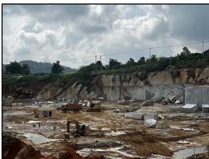
บริเวณพื้นที่ทำเหมืองหินอ่อน