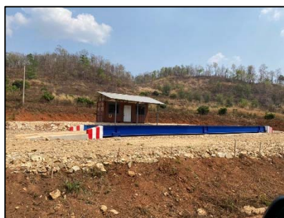
ลานขังน้ำหนัก