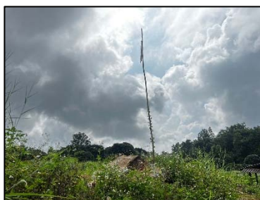
5. สัญลักษณ์แสดงขอบเขต การทำเหมือง