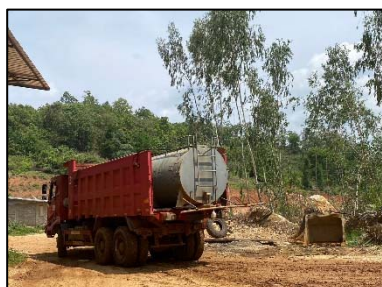
7. รถฉีดพรมน้ำ