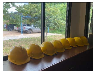
9. อุปกรณ์ป้องกันอันตรายส่วนบุคคล