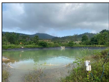
4. บ่อตกตะกอน