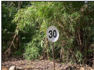
2. ป้ายจำกัดความเร็ว 30 กม./ชม.