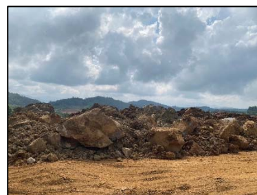
6. พื้นที่เก็บกองเปลือกดิน