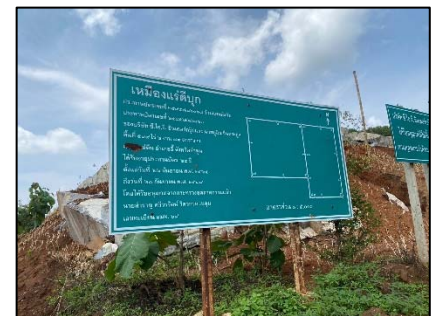
ป้ายข้อมูลการทำเหมืองของ โครงการ