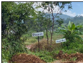
1. ป้ายห้ามล่าสัตว์และห้ามเผาป่า